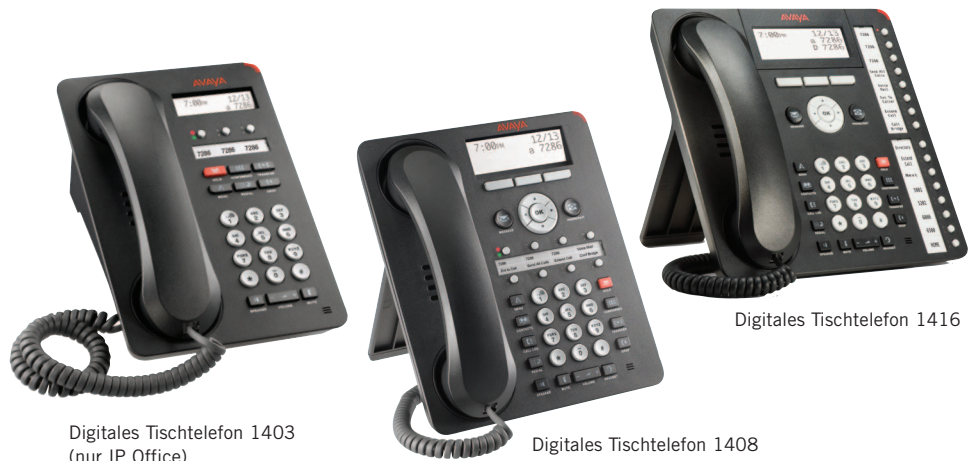
Digitales Tischtelefon 1403 (nur IP Office)

Die Serie 1400 digitaler Tischtelefone kombiniert herkömmliche Telefonfunktionen wie z. B. LED-Anzeigen und fest programmierte Funktionstasten (z. B. Konferenz, Übergabe, Halten) mit Optimierungen im Bereich Be-